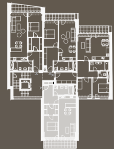
situace bytové jednotky celkový půdorys