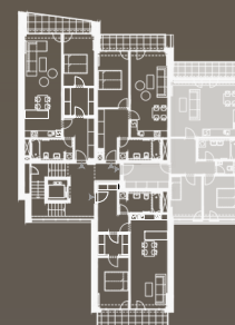
situace bytové jednotky celkový půdorys