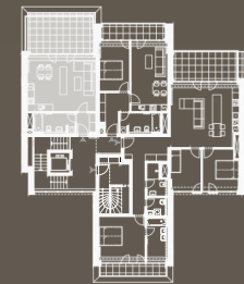
situace bytové jednotky celkový půdorys